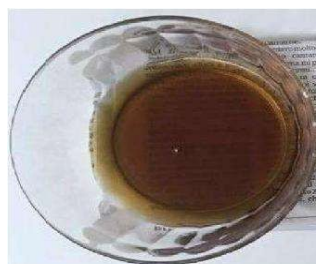
Preparazione NON ADEGUATA

Un semplice metodo per essere certi dell'efficacia della preparazione assunta è verificare che le ultime evacuazioni siano liquide e di colore chiaro.